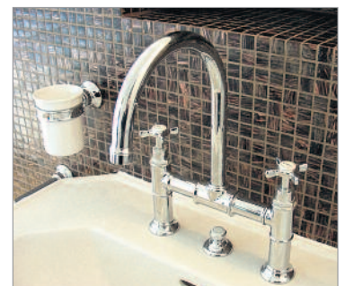
Formschöne Sanitär-Einrichtungen mit Schweizer Installationsqualität.