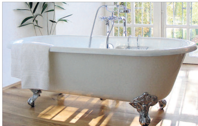
Zum Schloss passendes Badezimmer von der Aescher Haustechnik-Firma.

Die EU-Beratungsstelle der Wirtschaftskammer Baselland wird inskünftig in loser Folge über interessante grenzüberschreitende Projekte sowie über die praktischen Erfahrungen von regionalen KMU berichten. Dies nicht zuletzt mit dem Ziel, bei Schweizer KMU allfällige Vorbehalte gegenüber Ausland-Aufträgen bzw. den Entsendegesetzgebungen speziell in Deutschland und Frankreich abzubauen.