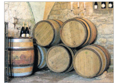
Der Weinkeller des Schlosses verspricht kulinarische Köstlichkeiten.

Inzwischen sind die Umbauarbeiten am Schloss abgeschlossen. Über