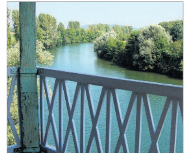
Die Landschaft am Doubs bietet vielseitige Erholungsmöglichkeiten