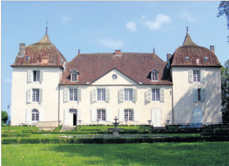
Château de Roche sur Loue im französischen Jura Nähe Besançon.

Ein Schweizer Investor hat vor kurzem das «Château de Roche sur Loue» im Département Doubs (französischer Jura) erworben. Nach einer umfassenden Renovation wird dieses Schloss nun als Zweitwohnsitz, aber auch als Gästehaus mit Hotelbetrieb genutzt. Die ursprünglich geplante Renovation mit französischen Handwerkern entsprach allerdings nicht den Qualitätsvorstellungen der Bauherrschaft. So entschied der Schlossherr, die gesamte Renovation mit Schweizer Handwerkern auszuführen. Die EU-Beratungsstelle der Wirtschaftskammer Baselland sorgte mit ihrer fundierten Beratung dafür, dass die behördlichen Hürden für die grenzüberschreitende Tätigkeit der Schweizer KMU relativ problemlos gemeistert werden konnten.